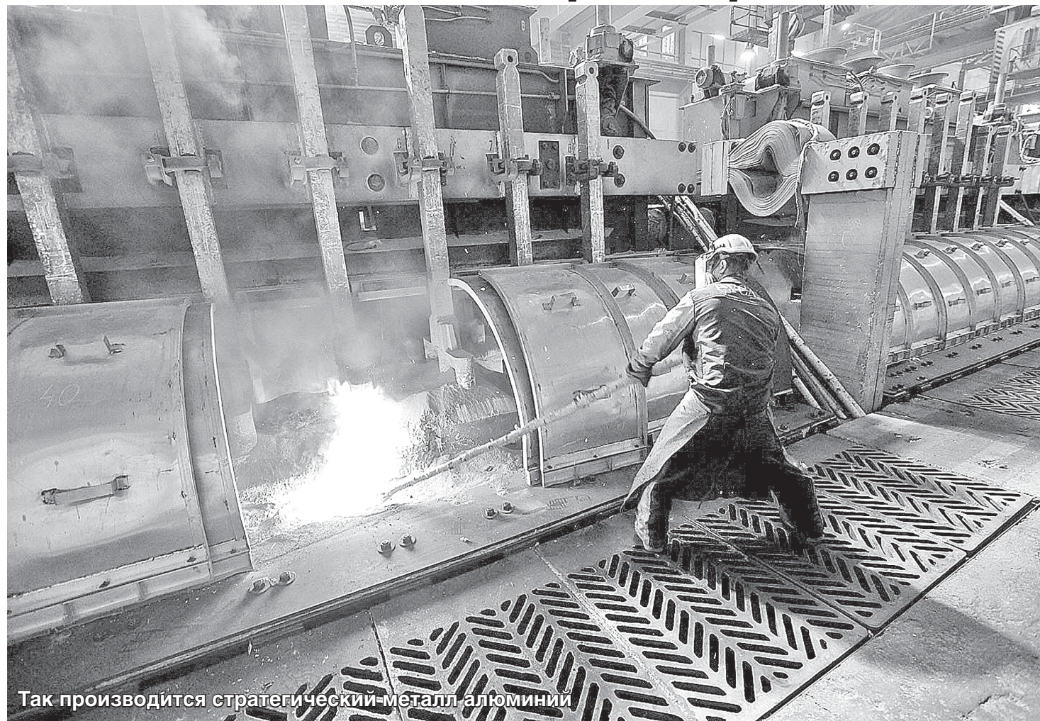
Так производится стратегический металл алюминий

В кабельной промышленности произошло важное событие. Министр энергетики Российской Федерации подписал приказ №968, отменяющий запрет правил устройства электроустановок (ПУЭ) на использование в жилых домах и постройках кабеля и провода с токопроводящей жилой из алюминия. Портал RusCable.Ru рассказал о сути проблемы и о том, почему это важно для кабельной отрасли.