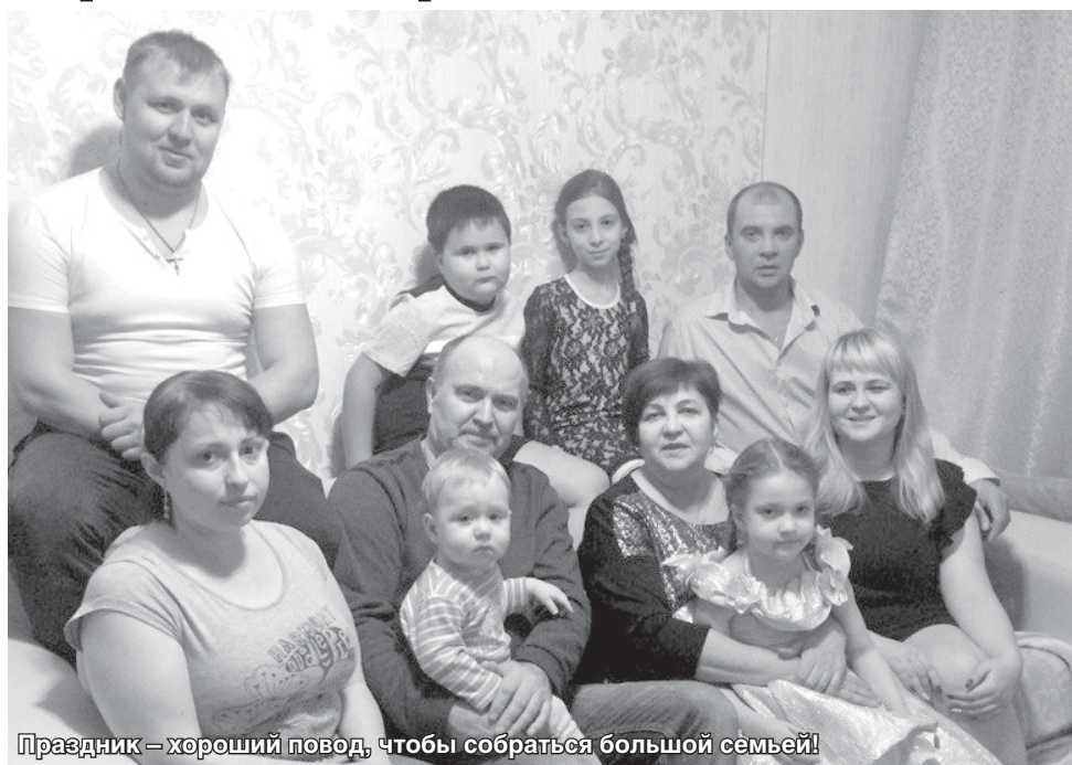
Праздник – хороший повод, чтобы собраться большой семьей!