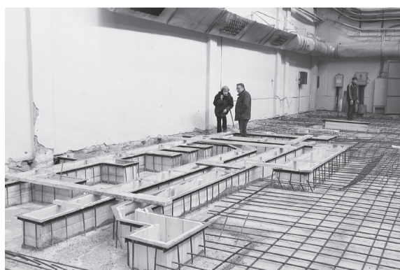
Специалисты отмечают отличное качество выполнения подготовительных работ