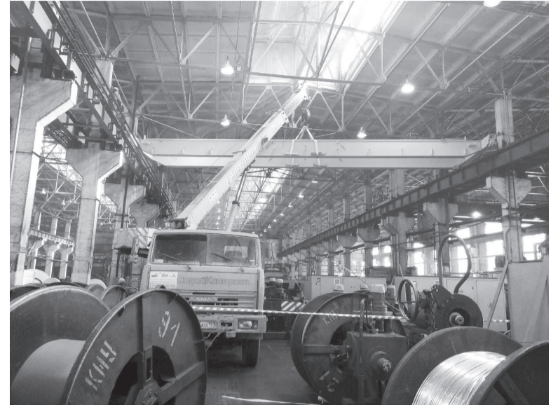
Подъем 7,5-тонного моста выполнен с ювелирной точностью

Чтобы успевать обслуживать оборудование крутильно-изолирующего и силового участков, протянувшихся на 270 метров, кранов в пролете два. Меняем тот, что работает с восточной стороны корпуса. Монтаж в разгаре. Увидеть, как будет выглядеть новый кран, можно в пятом пролете.