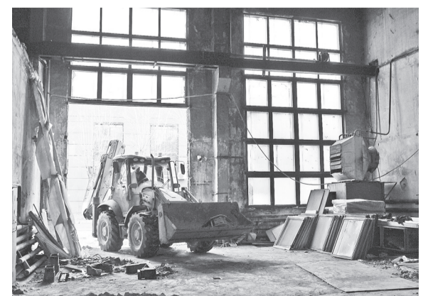
Строительная техника не мешает работе основного производства