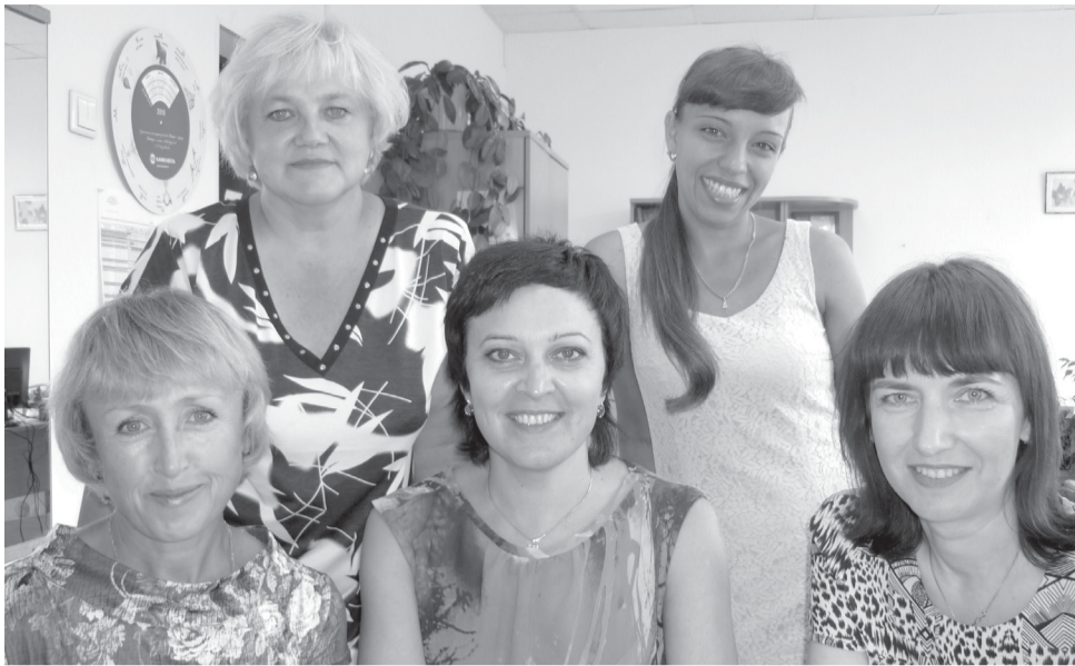
В таком составе встречают свой праздник заводские строители