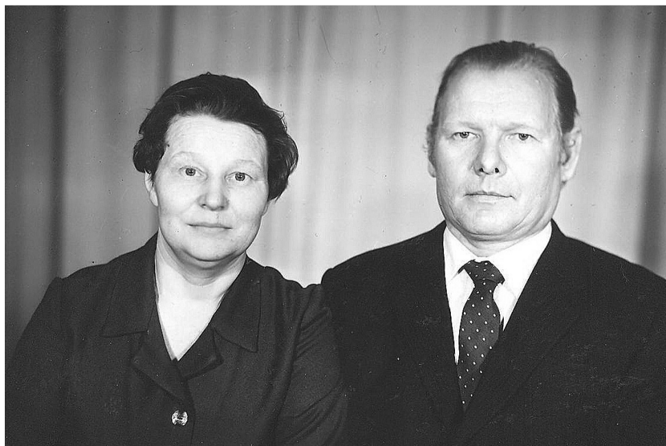
Основатели семейной династии