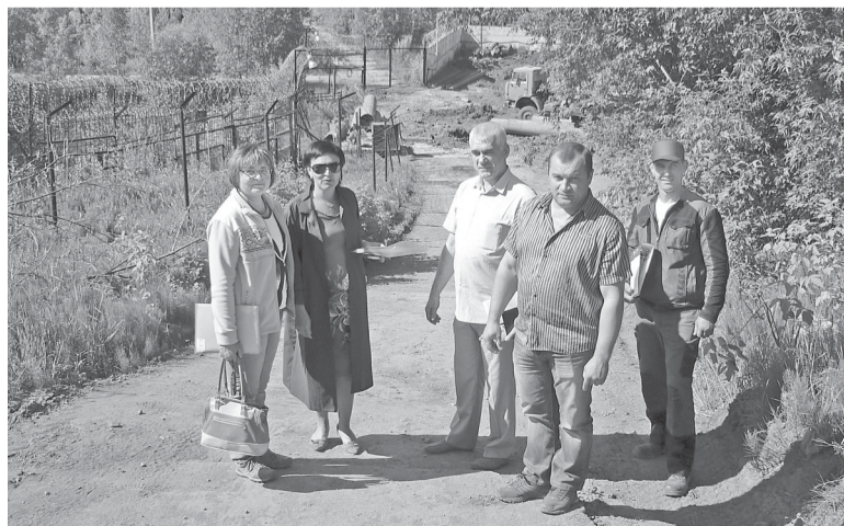
Специалисты ОКСиР и компании-подрядчика вышли на строительную площадку вместе с представителем комиссии Госстройнадзора