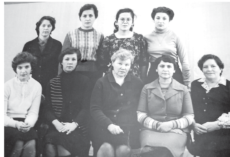
Они были первыми