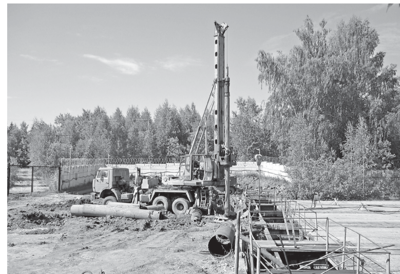
Ведутся земляные работы