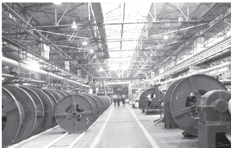
Разделение участка пойдет на пользу производству